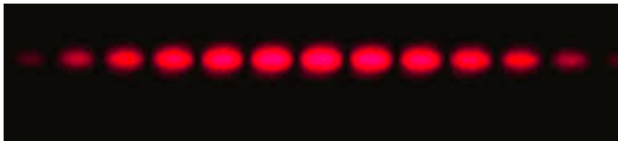
Document 2 : Figure d'interférence obtenue

Un laser rouge de longueur d'onde \lambda = 633 \text{ nm} , éclaire deux petits trous espacés d'un écartement e . On se place au point M sur l'écran.